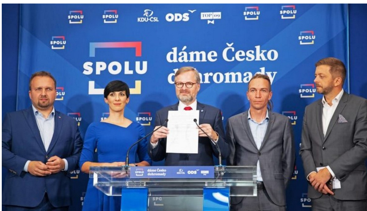
Memorandum SPOLU (ODS, TOP 09, KDU-ČSL) a PIRSTAN (Piráti a STAN) po sněmovních volbách 2021

Počátkem listopadu 2021 si poslanci v tajné volbě na ustavující schůzi nové sněmovny do svého čela zvolili kandidátku SPOLU Markétu Pekarovou. Nová předsedkyně v projevu po svém zvolení směrem k veřejnosti uvedla: „Já se budu snažit ze všech sil, abych právě důvěru v naši komoru parlamentu, tedy v Poslaneckou sněmovnu, zvyšovala. Je to úkolem nás všech, ale já se budu snažit v tomto být v čele těch, kteří se o to snaží.“ V reakci na Kverulantova zjištění slíbilo vedení Poslanecké sněmovny omezit jeden z velmi viditelných benefitů práce českých zákonodárců – zahraniční služební cesty.