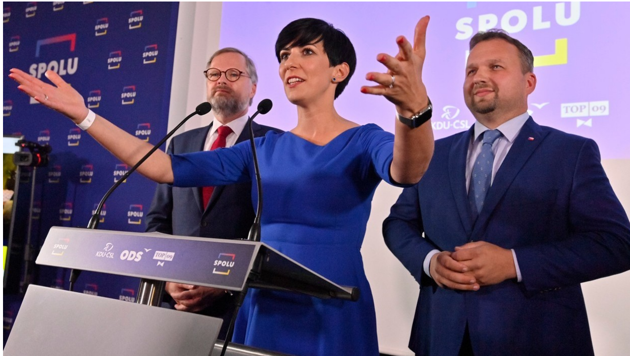
Petr Fiala, Markéta Pekarová Adamová, Marian Jurečka

Mnozí zákonodárci si z Poslanecké sněmovny učinili cestovní kancelář do exotických destinací za peníze daňových poplatníků. Kverulant.org již dvakrát přistihl poslance na výletě na Machu Picchu, do Austrálie a na Nový Zéland. Kverulant považuje všechny tyto cesty za ukázkový příklad okázalého papalášství a vedení Poslanecké sněmovny už několikrát vyzval, aby pravidla pro cesty poslanců zpřísnilo. Na počátku roku 2022 mu to slíbila předsedkyně sněmovny Markéta Pekarová Adamová. Slíbila také, že sněmovna ušetří na provozu 40 milionů korun. Svůj slib nedodržela. Naopak, sněmovna v roce 2022 pod jejím vedením utratila oproti minulým rokům o 141 milionů víc. Ani v roce 2023 sněmovna rozpočet nedodržela, a to si ho oproti roku 2022 navýšila o 90 milionů. Sněmovna v roce 2023 utratila o 46 milionů víc. Kverulant odhaluje papalášské manýry a plýtvání veřejnými penězi už od roku 2009. Prosíme, kontrolujte politiky s námi finanční podporou naší práce.