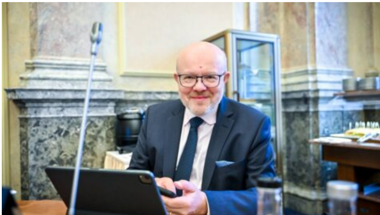
TOP 09 má čtyři kandidáty na ministra pro vědu a výzkum