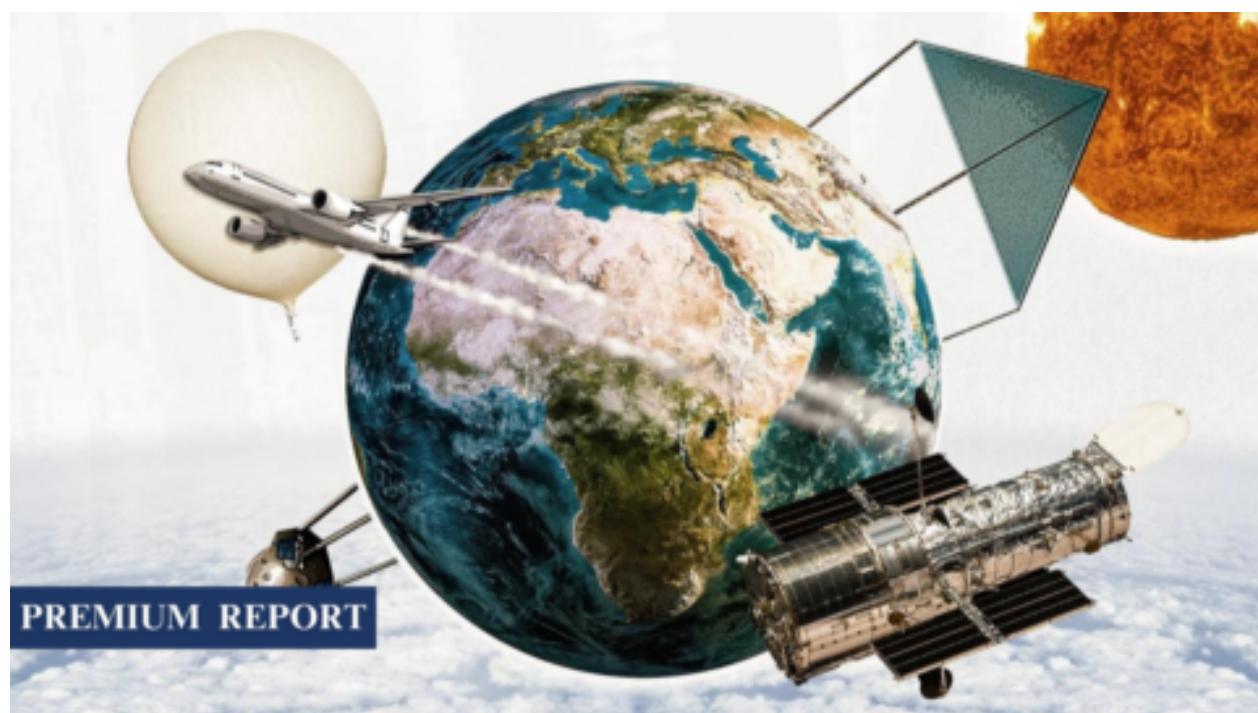
Drastické a nevratné klimatické geoinženýrství znepokojuje vědce