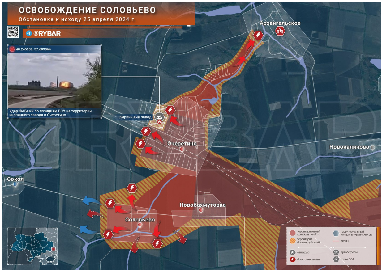
Ruská mapa bojů okolo Очеретине ve dnech 23. až 25. dubna.