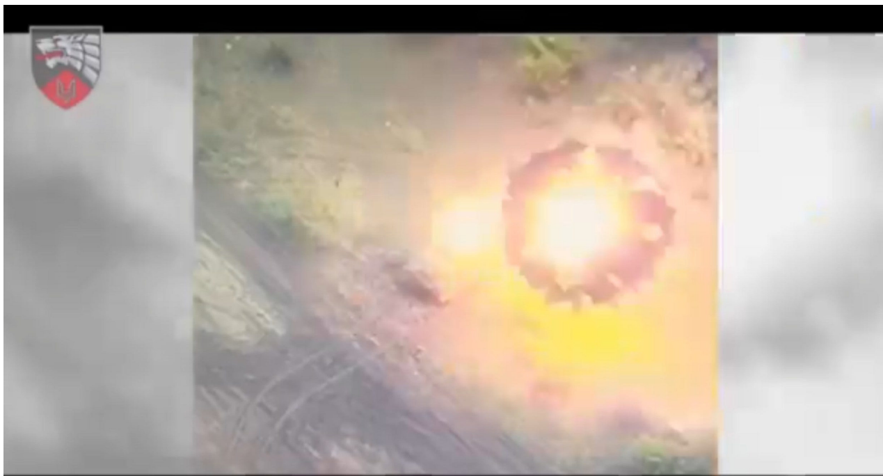
Přímý zásah HIMARS do ruského odpalovacího zařízení Buk (díky 3. průzkumu SSO).

Nejlépe fungují ruské vícenásobné raketomety BM-27 (220 mm) a BM-30 (300 mm). S dosahem kolem 35, respektive 120 km a dobrou pohyblivostí mohou pálit z pozic vzdálenějších od přední linie. To je obvykle chrání před ukrajinskými FPV a houfnicemi s dlouhým doletem, jako je Caesar francouzské výroby (zbraně, které se Rusové bojí nejvíce, protože s dosahem 42 km snadno předčí téměř vše, co mají v arzenálu).