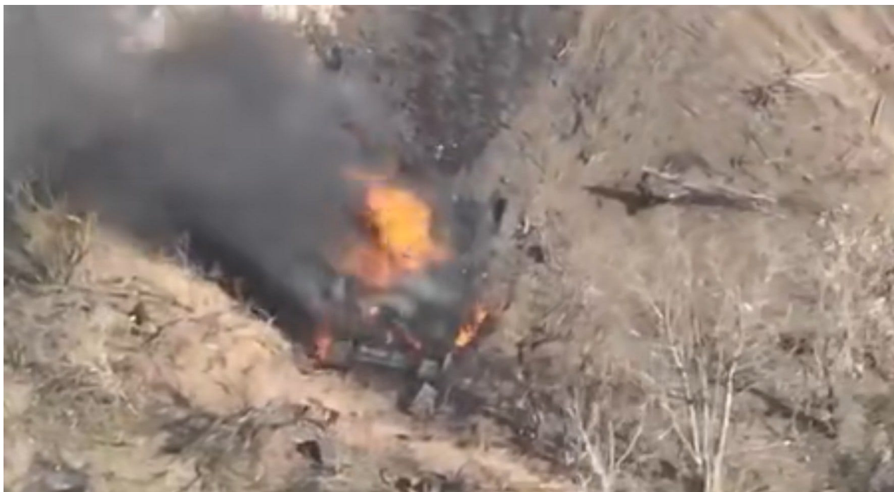
Ruská samohybná houfnice 2S3 Akatsiya ráže 152 mm, vyhozená 2-3 zásahy FPV, 10. dubna.

Dokonce i ruská protivzdušná obrana rozmístěná podél frontové linie měla v poslední době špatné dny: