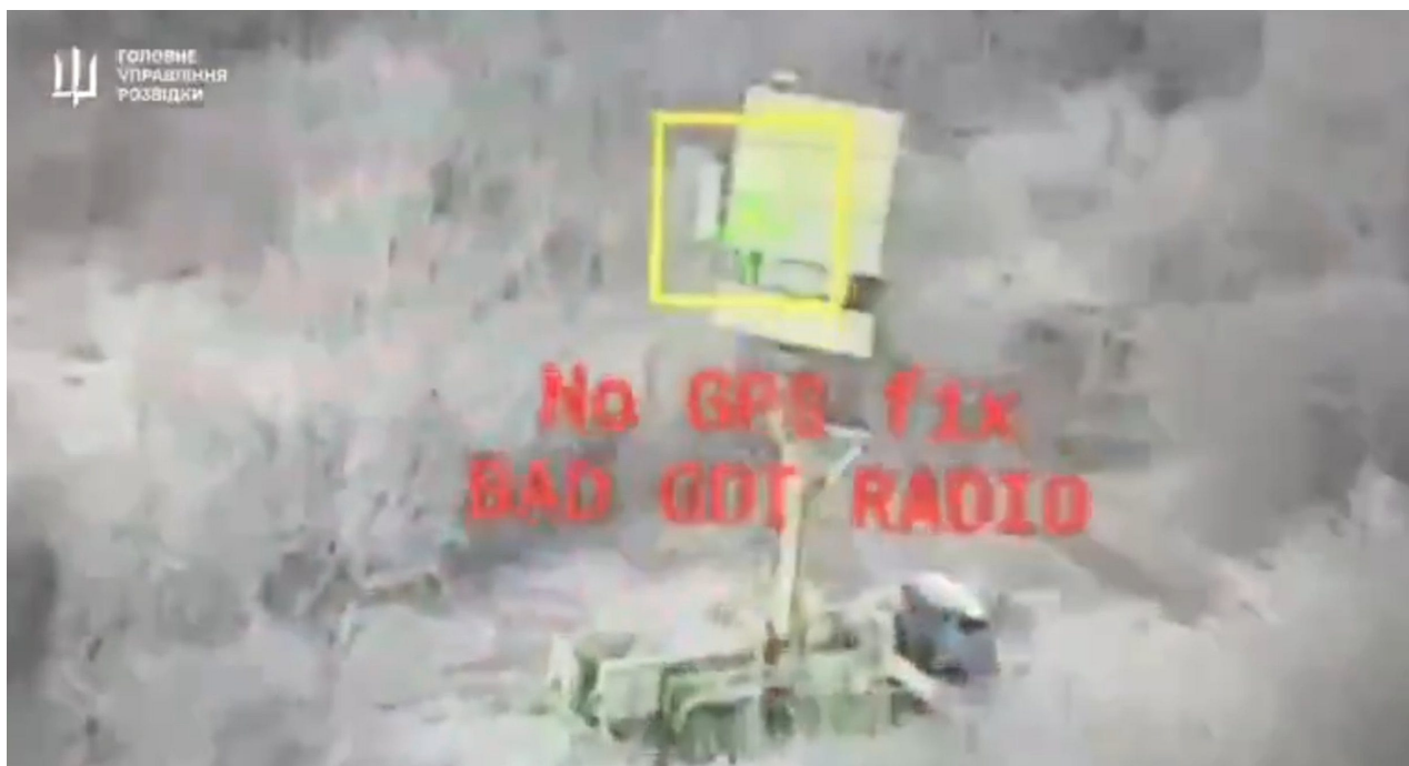
Video pořízené Warmate PGM (vyrobeno v Polsku), které ukazuje ruský radar Podlet K1, který má být zasažen.

Dokonce i ruská protivzdušná obrana rozmístěná podél frontové linie měla v poslední době špatné dny: