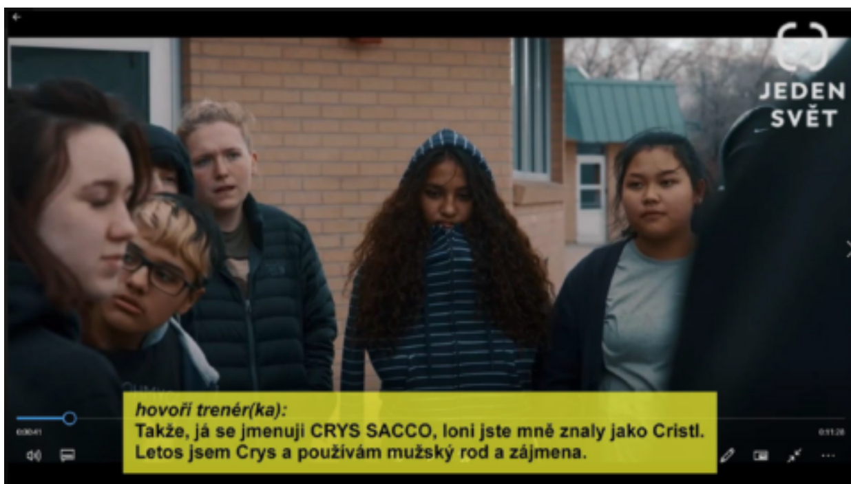
Neziskovka promítala na základní škole film o transgenderu, rodičům nebylo umožněno snímek vidět