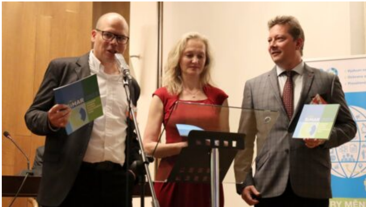
Příznivci i odpůrci EU se považují za realisty, jen 13 % Čechů si váží vedení země. Konference průzkumů