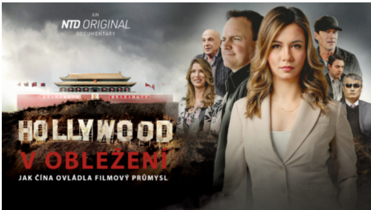
„ Hollywood v obležení: Jak Čína ovládla filmový průmysl! “