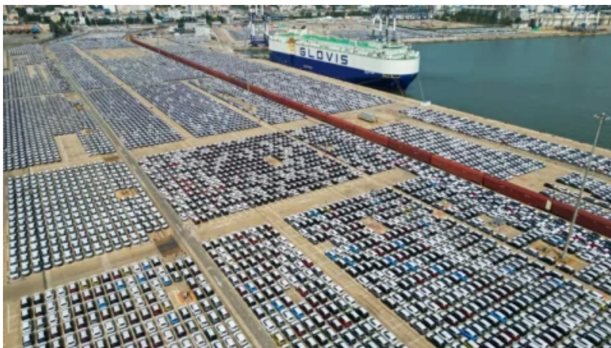
Strategie Číny na likvidaci evropského průmyslu