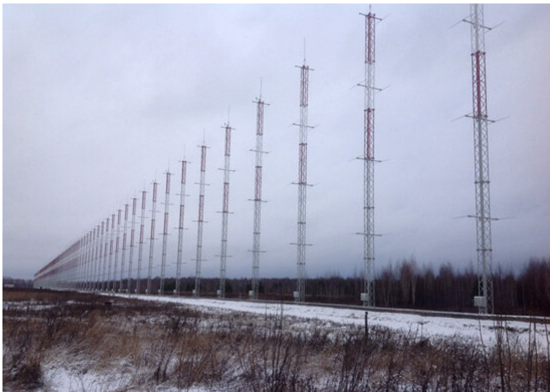
Přijímací antény radaru Container.