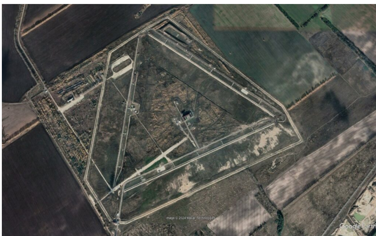
Satelitní pohled na radar Container – jsou dobře vidět jeho vysílací antény – vytváří trojúhelník.