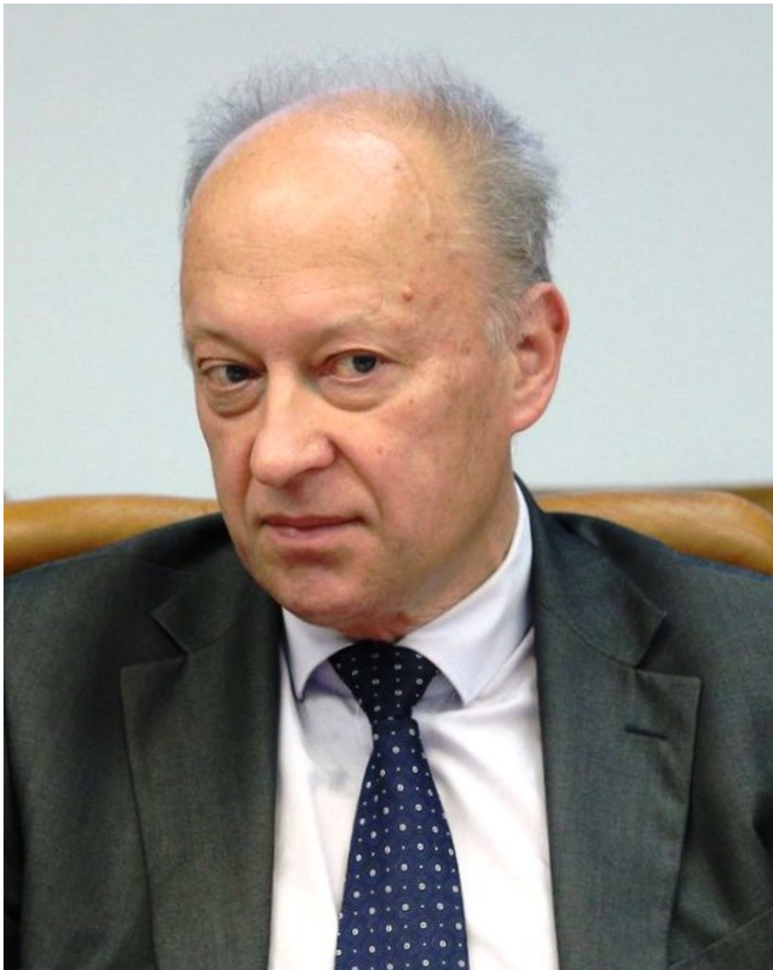
Andrej Kortunov, významný ruský akademik předpověděl další vývoj války na Ukrajině. Kortunov je na západním sankčním seznamu.