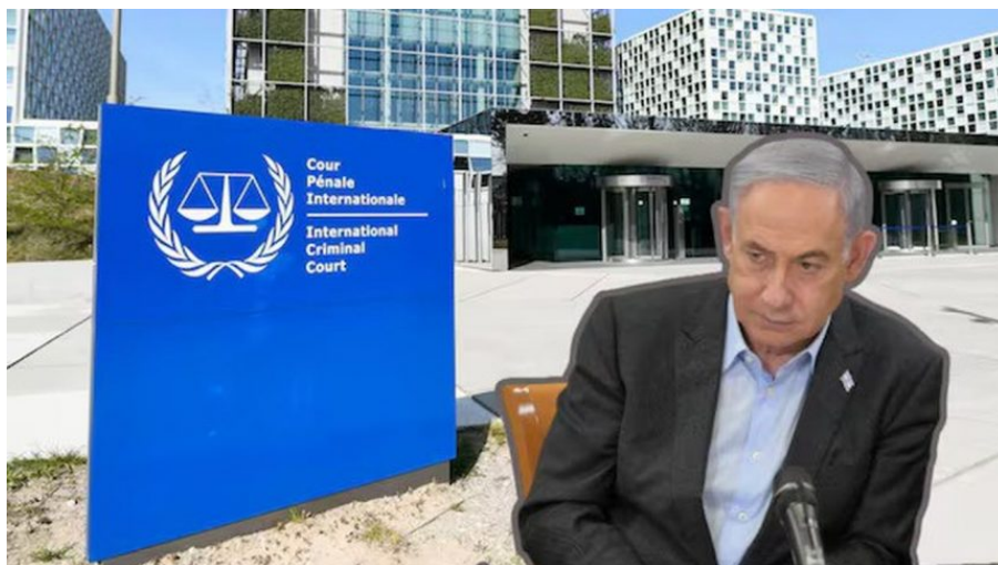
Benjamin Netanyahu, premiér Izraele

Tato systematická deprivace byla důsledkem rozhodnutí uvalit na Gazu úplné obklíčení tím, že byly na delší dobu zcela uzavřeny tři hraniční přechody Rafáh, Kerem Šalom a Erez a že byla svévolně omezena přeprava základních zásob včetně potravin a léků přes tyto hraniční přechody poté, co byly znovu otevřeny. Obléhání, úplné obléhání, zahrnovalo také přerušení přeshraničního vodovodu z Izraele do Gazy, který je hlavním zdrojem čisté vody pro obyvatele Gazy. K jeho přerušení došlo na delší dobu počínaje 9. říjnem 2023 a bylo doprovázeno přerušením nebo ztížením dodávek elektřiny do Gazy od 8. října 2023 do současnosti. Toto jednání probíhalo souběžně s útoky, při nichž byli zabíjeni civilisté včetně lidí stojících ve frontě na potraviny, s bráněním humanitárním organizacím v dodávkách pomoci a s útoky na humanitární pracovníky, které přinutily mnohé z těchto humanitárních organizací buď ukončit činnost, nebo omezit své úsilí o záchranu životů v Gaze.