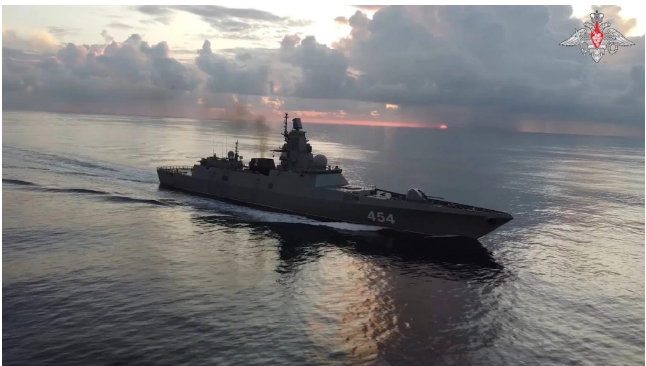
Ruská fregata Admirál Gorškov, vybavená hypersonickými zbraněmi, na cestě na Kubu.

Rusové vyslali vlastní zprávu do Washingtonu tím, že vyslali na Kubu ruské válečné lodě a jaderné ponorky.