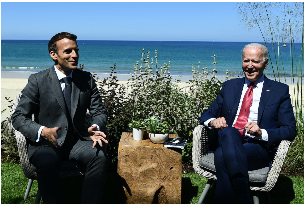
Francouzský prezident Emmanuel Macron (L) zdraví amerického prezidenta Joea Bidena před bilaterálním setkáním během summitu G7 v Carbis Bay, Cornwall, 12. června 2021.

Takové myšlenky jsou ze své podstaty riskantní, protože obranná schopnost NATO je ostudně nízká. Vystavovat alianci a budoucnost Evropy riziku jen kvůli setrvání ve funkci je samo o sobě hanebné a pravděpodobně trestné, pokud je to pravda.