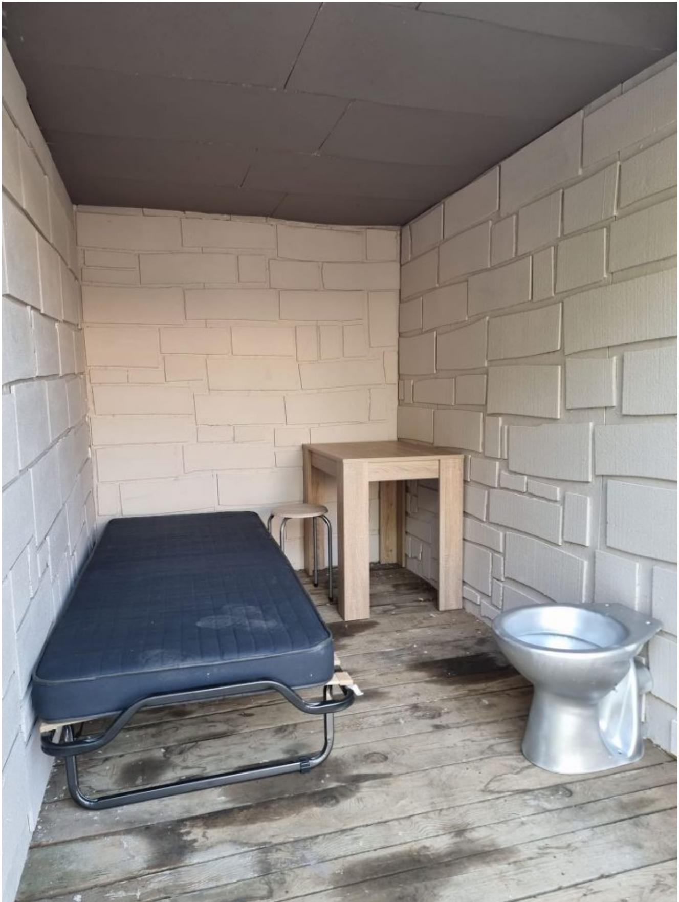
Věrná reprodukce Assangeovy cely, ve které byl více než 3,5 roku z celkem více než 5 let věznění