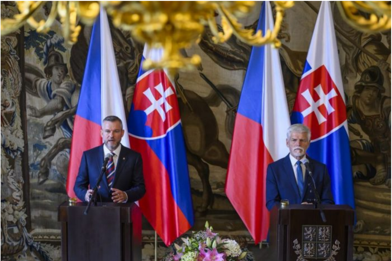
Peter Pellegrini a Petr Pavel v Praze na Pražském hradě

instruktorů NATO. Má to být první krok v rámci klasické salámové metody. Nejprve instruktoři, později opraváři vojenské techniky, později jednotky PVO obrany na ochranu těch opravářů a vojáků, až nakonec dojde k nasunutí bojových skupin NATO na Ukrajinu. Klasická metoda postupného pouštění ventilu, pomaličku, více a více, až se místnost napustí plynem a nikdo to nepřežije. A co je podstatné?