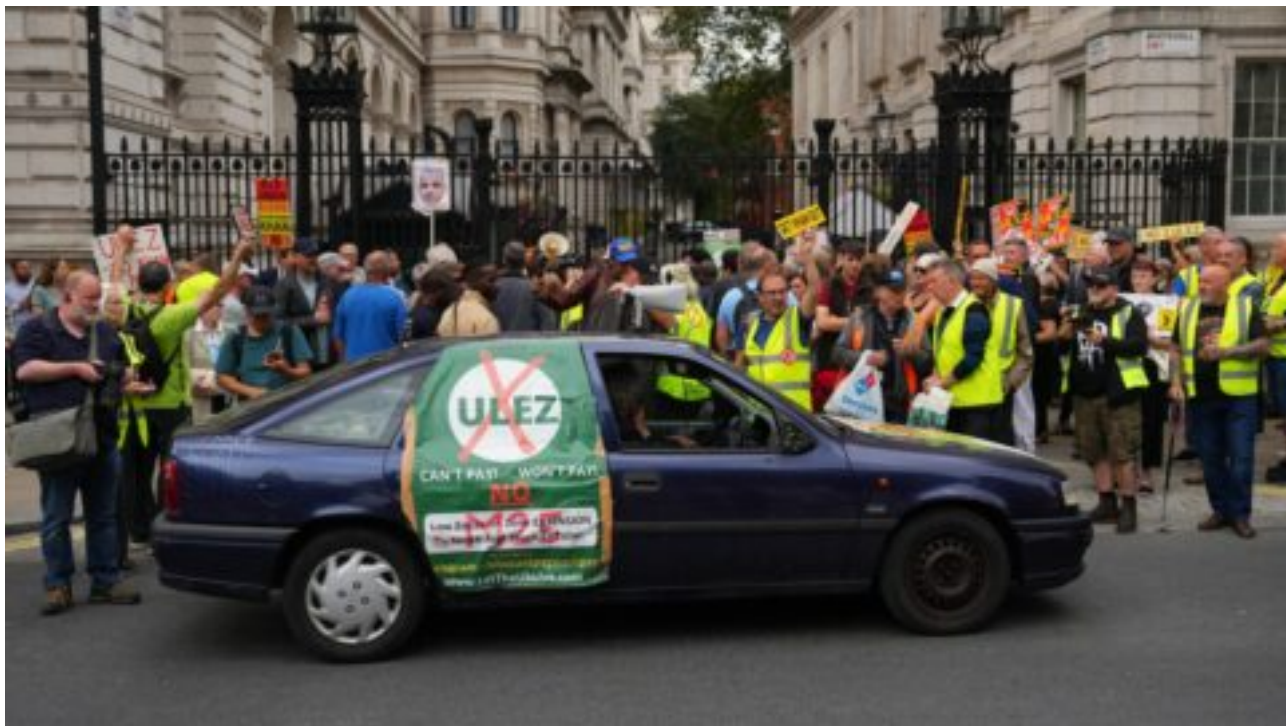
Británie: Odpůrci ekoplatku pro stará auta koordinovaně ničí monitorovací kamery