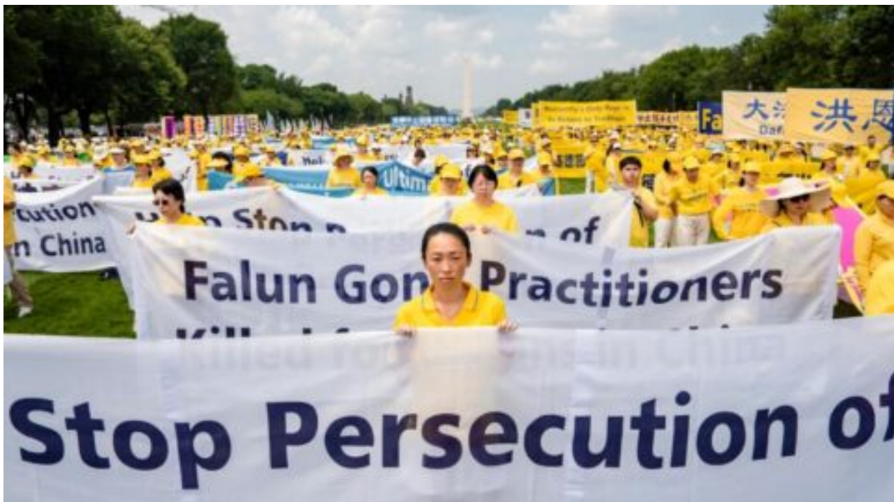
Dolní komora Kongresu USA přijala návrh zákona proti násilným odběrům orgánů praktikujícím Falun Gongu v Číně