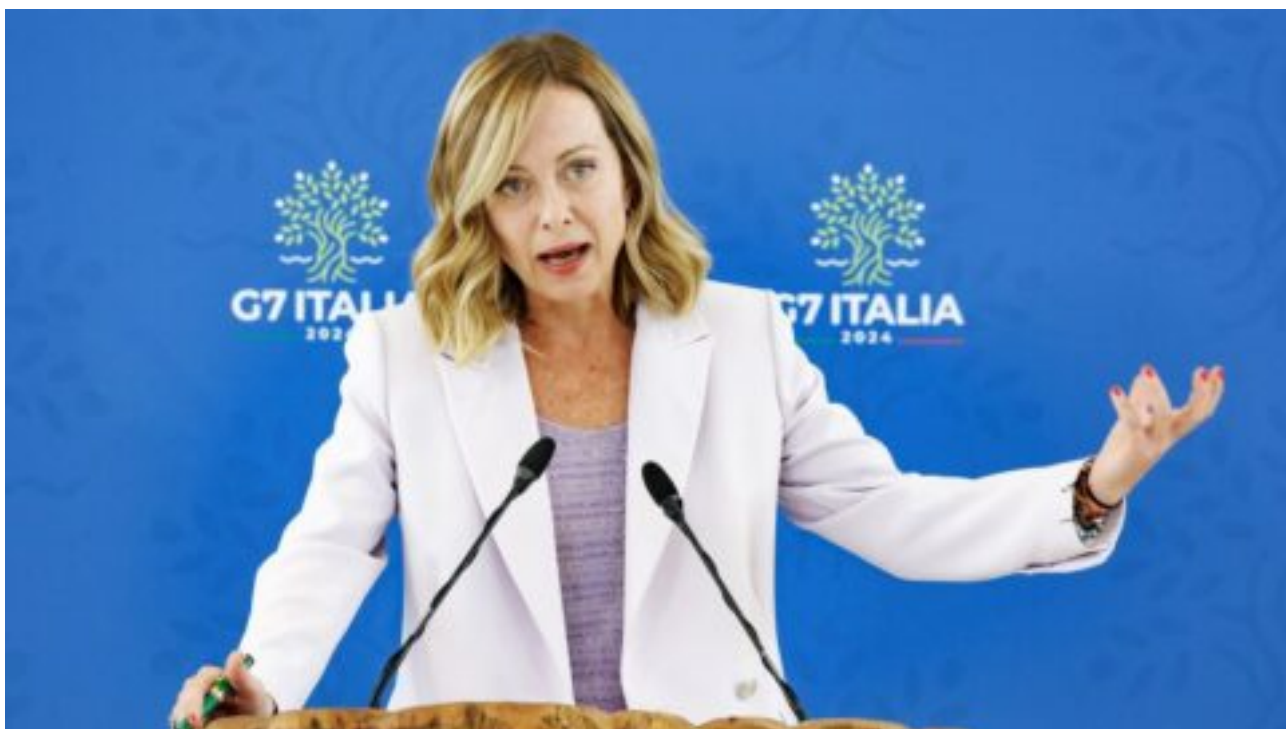
Italská premiérka kritizovala rozdělení nejvyšších funkcí v Evropské unii