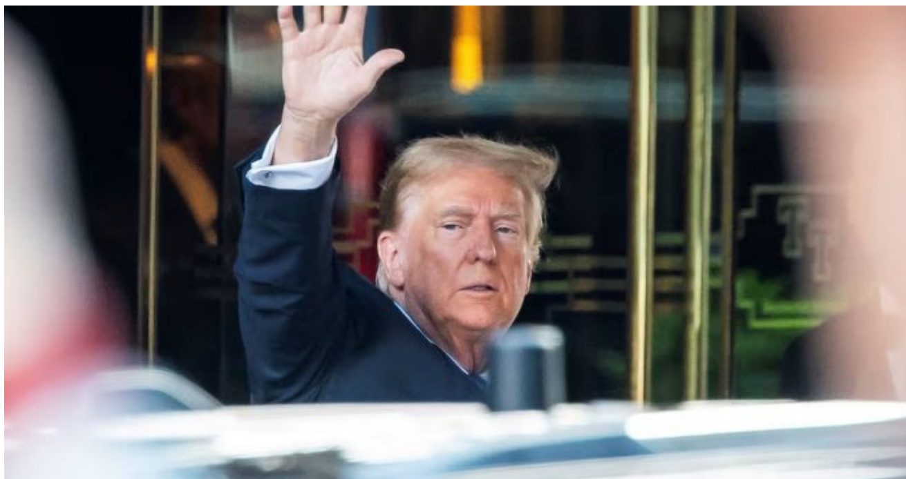
Donald Trump zdraví příznivce při odjezdu od soudu v New Yorku

Trumpova obhajoba, platba peněz Trumpovu právníkovi Michaelu Cohenovi, který měl penězi herečku uplatit, proběhla až v roce 2017 poté, co již Donald Trump byl v úřadu prezidenta. Jinými slovy, rozsudek z konce května, kdy porota shledala Trampa vinného v této kauze ve 34 bodech obžaloby, je teď v podstatě zpochybněn.