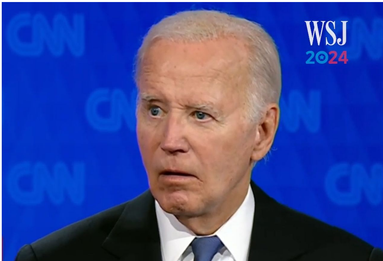
Joe Biden v debatě s Donaldem Trumpem

Michelle Obamová již dříve v roce 2019 vyjádřila svůj nezájem ucházet se o prezidentské křeslo a hrát jakoukoli aktivní roli v politice. Nedávno totéž řekla Oprah Winfreyová, že nemá zájem o účast ve volbách a že se orientuje na služby. Vyjádřila však své obavy z vyhlídek na Trumpovo vítězství ve volbách. Bidenovi vyjádřila plnou podporu.