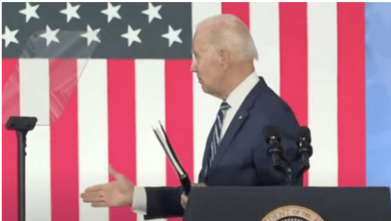
Joe Biden podává ruku duchovi

Průzkum ukázal, že dokonce i mezi demokraty si přibližně 45% myslí, že by měl z kandidatury odstoupit. Jedinou otázkou teď je, kdo Bidena nahradí? Podle průzkumů jedinou šanci proti Trumpovi má Michelle Obama. Není proto vyloučeno, že Kamala Harris jako viceprezidentka zaskočí za Bidena v kampani, zatímco se oficiálně bude hledat nový kandidáty. Nominační kongres mají demokraté ve druhé polovině srpna, což je měsíc a půl času.