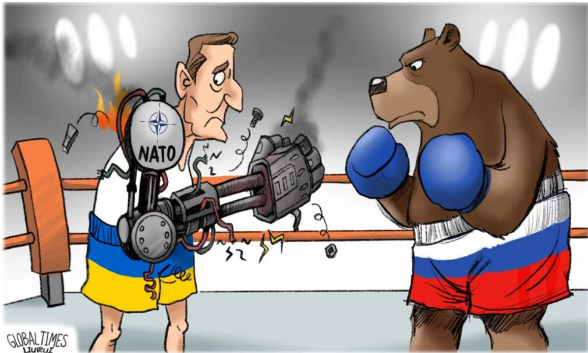
Nejnovější čínský vtíp o vojenské pomoci NATO Ukrajině.

Putin a Rusko se ukázali v posledním měsíci ve stejném postavení “nejžádanější nevěsty”, jako byly ve středověku “dcery mocných králů”. Rusko možná není finančně nejsilnější mocnost světa jako USA. Není ani průmyslový gigant světa jako Čína. Ale je politicky nejoblíbenější zemí po celém světě, s výjimkou několika málo státek, které ještě řídí do ekonomické záhuby různí fialoví vladaři. A všechny tyto nefialové země vidí v Rusku garanta světového míru, stability a rovného zacházení se všemi zeměmi světa. Rusko je přitom, jak ukázala ukrajinská válka vojensky nejsilnější zemí světa, a jeho obrovské přírodní zdroje ho nenutí k žádné další expanzi. Rusko je tak v přirozeném postavení hlavního stabilizačního prvku budoucího multilaterálního uspořádání světa. USA a Rusko nemají přirozené konkurenční třecí plochy, jakmile se USA přestanou snažit ovládnout svět. Trump si uvědomuje, že svět se v posledních deseti letech natolik rozvinul, že už nebude mít jednoho hegemonu, jako tomu bylo posledních 40 let. A že Rusko dokonce představuje přirozenou pojistku USA proti Číně, stejně jako pojistku Číny proti USA. Ostatně proto indický Modí vyráží do Moskvy. Rusko je i pojistkou Indie proti Číně, a