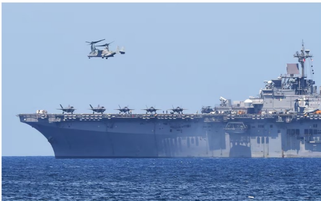
Американский Osprey взлетает с USS Wasp, многоцелевого десантного корабля ВМС США.

► В новостях сообщается, что корабли направляются в Средиземное море для эвакуации американцев с помощью военных