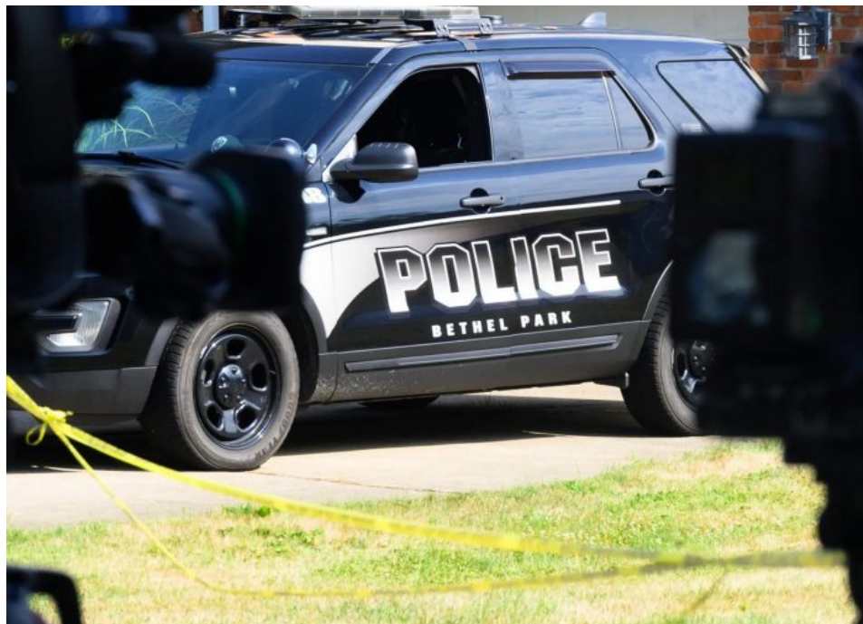
Místní policie před domem Crooksových rodičů v Bethel Parku

Přihlásili se bývalí spolužáci, kteří tvrdí, že dvacetiletý mladík byl “samotář” a byl “šikanován” svými vrstevníky. “Ty ostatní děti mu vždycky říkaly: ‘Hej, podívej se na támhletoho školního střelce!’” řekl [5] jeden z bývalých studentů The New York Times s odkazem, že děti se mu posmívali, že ho nevzali do střeleckého týmu kvůli špatnému zraku a brýlím. “Posmívali se mu i kvůli jeho špatné hygieně, tělesnému zápachu. Byl snadným terčem.”