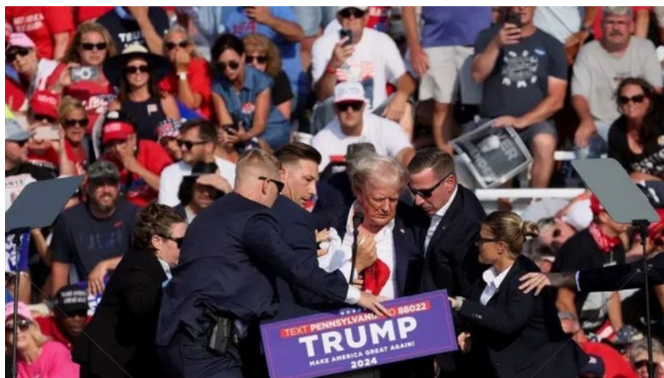
Donald Trump těsně po střelbě v Butleru

Tyto informace nasvědčují, že Thomas Crooks pracoval pro FBI v rámci nějaké sting operace v prostředí levicových radikálů, kteří se měli chytit do pasti FBI okolo fingované přípravy bombového útoku. Crooks byl totiž několikrát zatčen za demonstrace Antify a je možné, že FBI ho donutila pod hrozbou vězení podepsat spolupráci na nějaké sting operaci. Prostě měl usvědčit nějakou skupinu radikálů, že chtěla obstarat výbušniny. Nakonec se ale ze sting operace stal atentát na Trumpa. Jak k tomu mohlo dojít, to je nejasné.