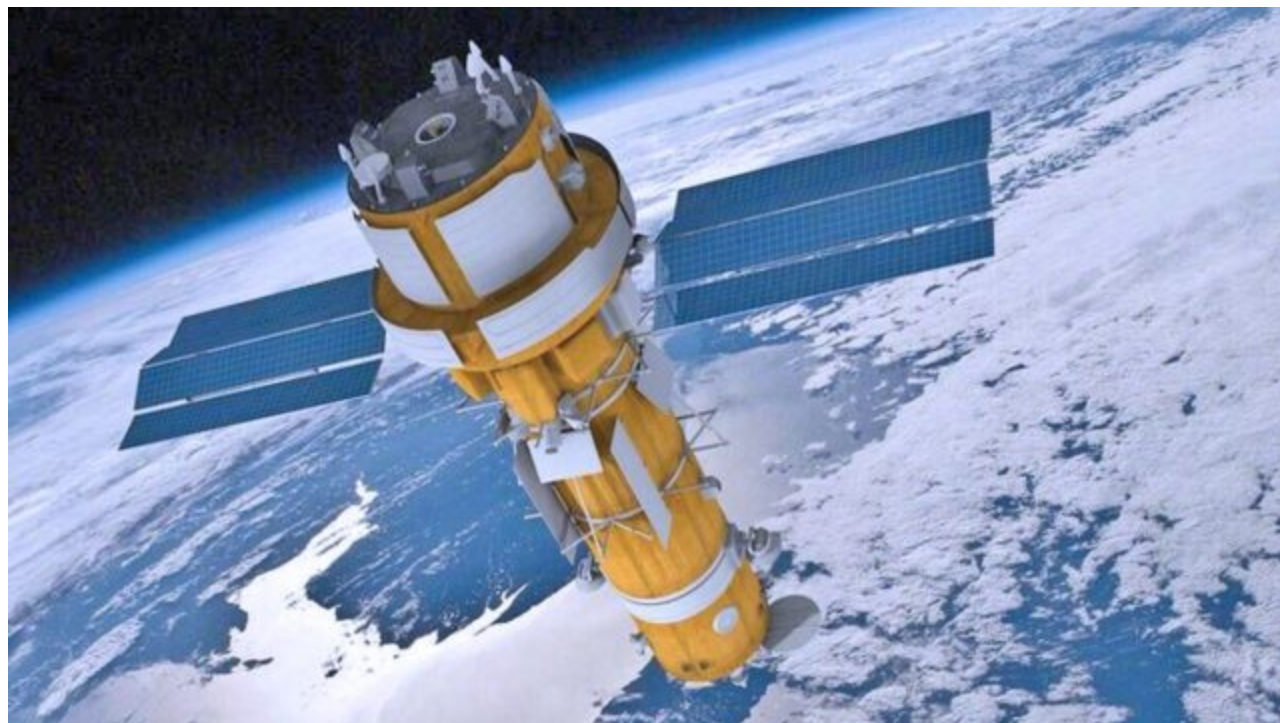
Odhadovaný výskyt ruského průzkumného satelitu "Bars-M" (14F148)

Je vhodné vzít v úvahu všechna výše uvedená data pro naše respektované publikum, abychom oddělili pravdu od fikce v nekonečných „senzacích“ západní propagandy o „příštích barbarských ruských útocích na kyjevské nemocnice a charkovské školky“. Ve kterém je zpravidla tolik „pravdy“ jako v celé „ruské agresi“ proti části původní ruské země zabrané Západem.