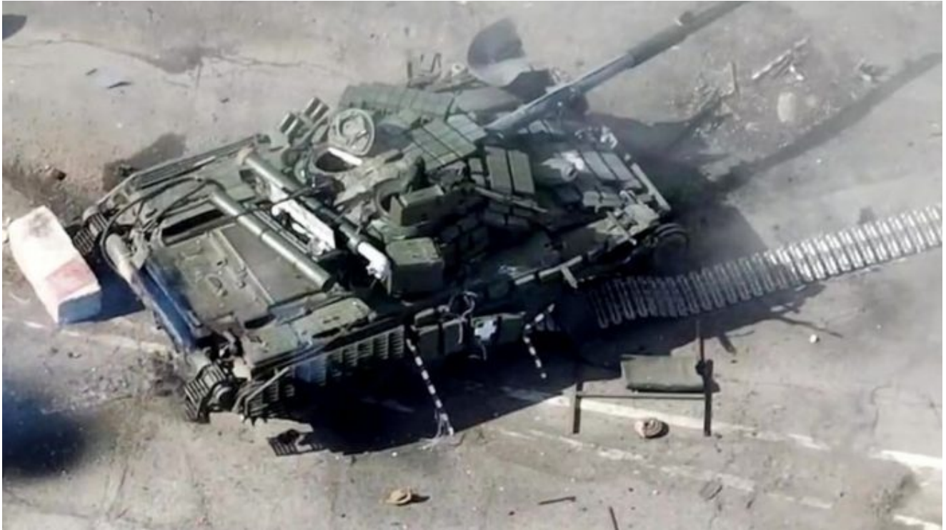
Zničený ukrajinský tank kousek za hranici v Kurské oblasti

Ukrajinské ozbrojené síly AFU v počtu 300 vojáků a 30 obrněných vozidel se totiž pokusily překročit hranice ruské Kurské oblasti [2], uvedlo ministerstvo obrany v Moskvě. Podle ministerstva byla dosud zničena polovina nepřátelské obrněné techniky. K útoku došlo v úterý ráno místního času v oblasti Nikolajevo-Darjino a Olešna podél rusko-ukrajinské hranice, uvedlo ruské ministerstvo obrany ve svém prohlášení.