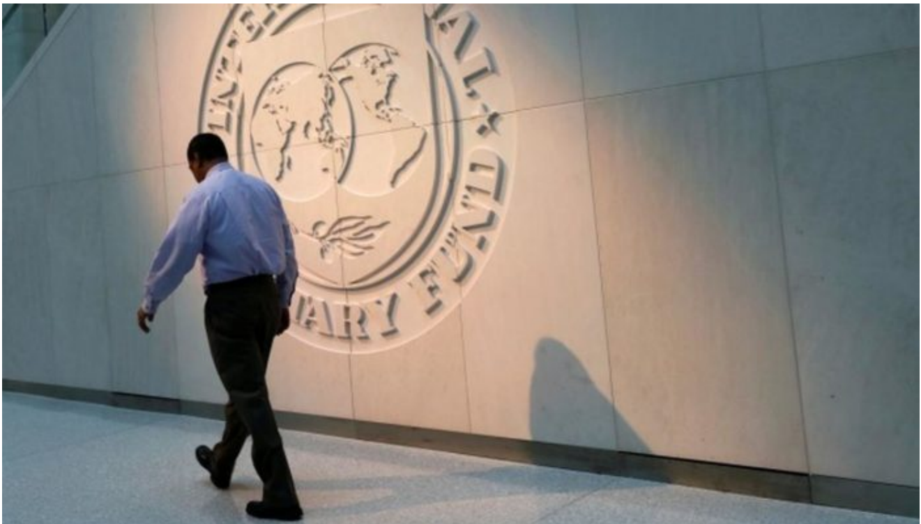
Před defaultem Ukrajiny varuje už i Mezinárodní měnový fond

Jedná se o druhou změnu v zemi za posledních deset let. Podobné řešení, které Kyjevu dávalo právo pozastavit splátky státního dluhu, bylo uplatněno v dohodě o restrukturalizaci z roku 2015. V květnu téhož roku Ukrajina přijala legislativu o specifikách transakcí se státním dluhem, dluhem se státní zárukou a místním dluhem, v srpnu následujícího roku dosáhla s věřiteli zásadních dohod a o několik měsíců později, v listopadu, oznámila uzavření dohody. Poslední dohodu o restrukturalizaci dluhu musí ještě schválit mezinárodní držitelé dluhopisů, přičemž se očekává, že vyřešení technických otázek, které za ní stojí, zabere týdny.