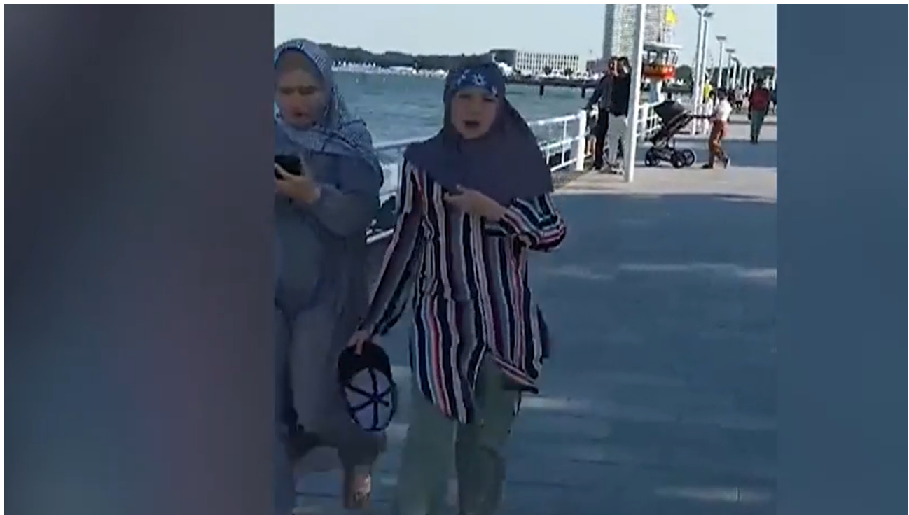
V neposlední řadě: Daleký sever, Travemünde u německého Baltského moře (viz také titulní obrázek), což je německé přímořské letovisko a turistický magnet.