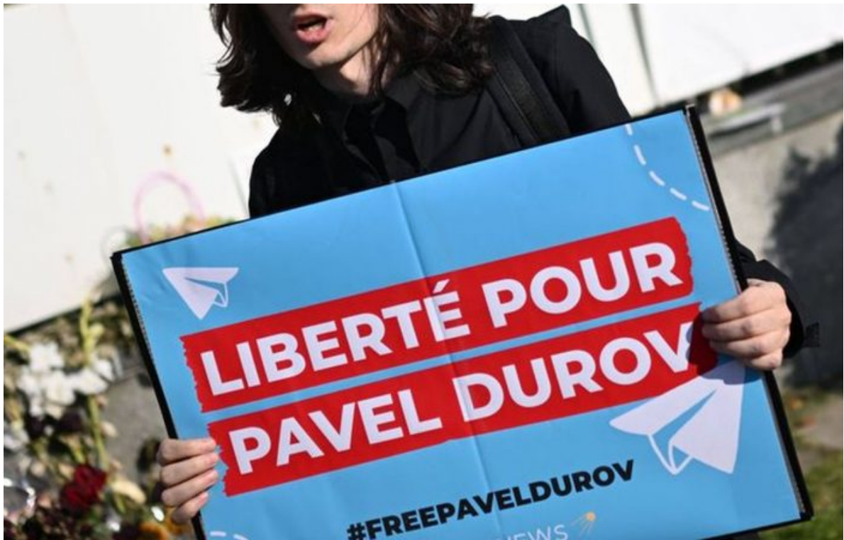
V Paříži vypukly protesty za propuštění Pavla Durova

Podle francouzské prokuratury Pavel Durov a jeho Telegram tak umožňují bezpečné volání pro kohokoliv, tedy i pro teroristy, obchodníky s drogami, s pornografií, kteří si bezpečně na síti Telegram mohou dojednávat kšefty, schůzky, prostě řídit business. Naprosto nechápu, jak si Pavel Durov mohl myslet, že může ignorovat francouzské orgány a nespolupracovat s nimi, když ho žádaly s spoluprací, a přitom Durov má od roku 2021 francouzské občanství!