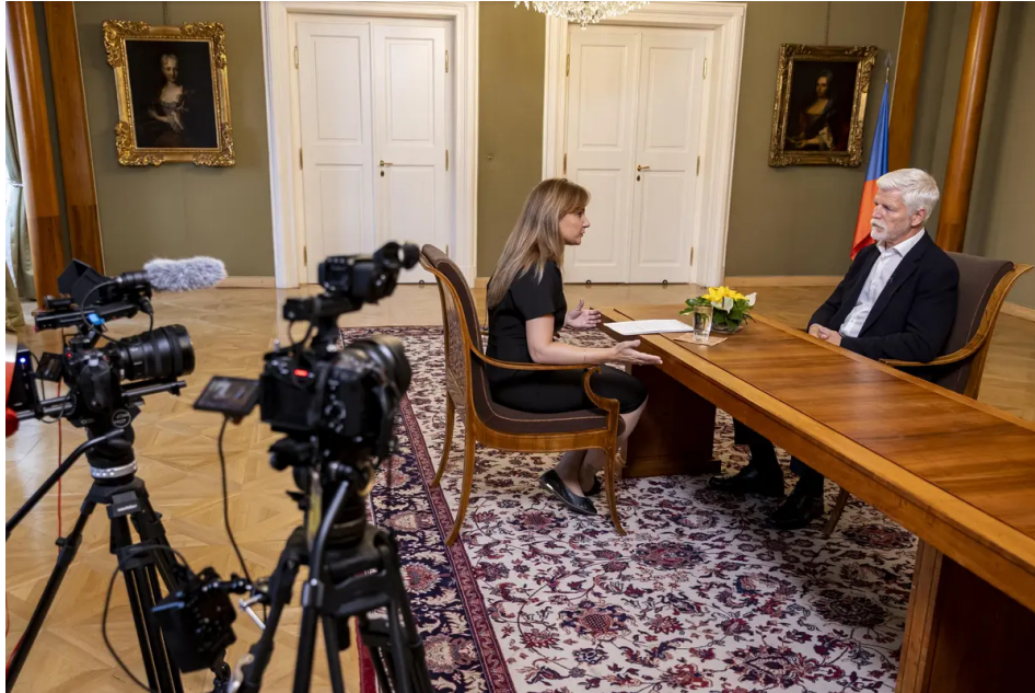
Prezident Petr Pavel při rozhovoru s Novinkami.cz

hlásí k respektování mezinárodního práva a Charty OSN, by mělo tedy dojít k tomu, že budeme respektovat dohodu mezi válčícími stranami, ale nebudeme akceptovat změnu mezinárodních hranic na základě agrese,“ dodal prezident.