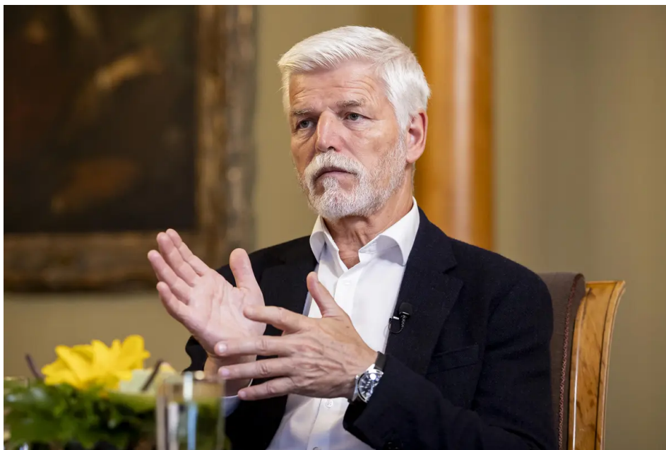
Prezident Petr Pavel

Souhlasí však s tím, že válka na Ukrajině se zatím nevyvíjí tak, že by bylo možné čekat v brzké době vítězství jedné či druhé strany konfliktu. „Je pravděpodobný scénář, že Ukrajina neosvobodí všechno, ale zároveň nepadne celá. A od toho se bude odvíjet další složité mírové jednání, ve kterém by Ukrajina mohla obětovat nějaké své území,“ dodal.