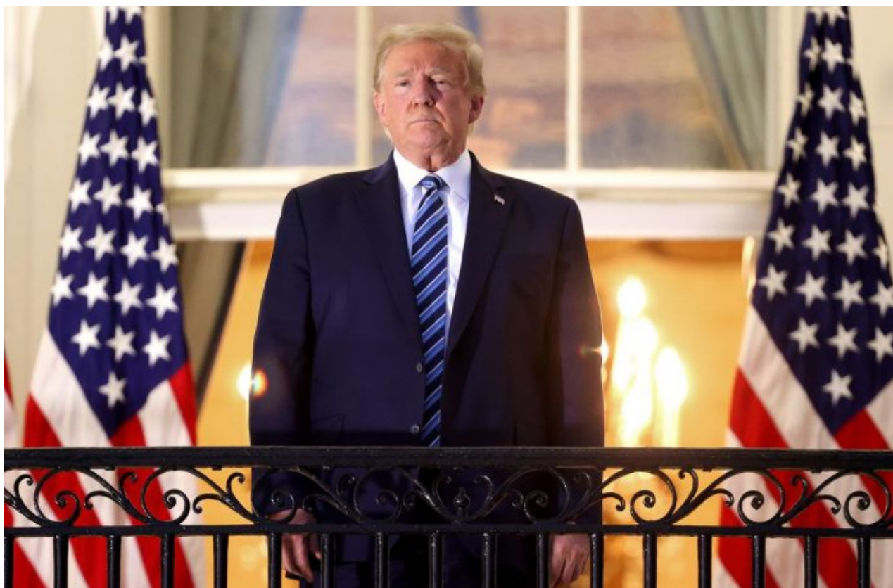
Donald Trump na balkóně Bílého domu

Západní země neuznají ruské hranice těchto regionů jako součást Ruska, ale údajně má NATO a Brusel plán, že donutí Ukrajince zastavit boje a “ztratit” území Donbasu. Za tímto účelem Kyjev stáhl z Donbasu elitní útvary své armády a vrhl je do Kurské oblasti. Jinými slovy, je to součást plánu, jakým Kyjev zdůvodní ztrátu Donbasu jako porážku a nikoliv jako odevzdání území. Je to naprosto jasné!