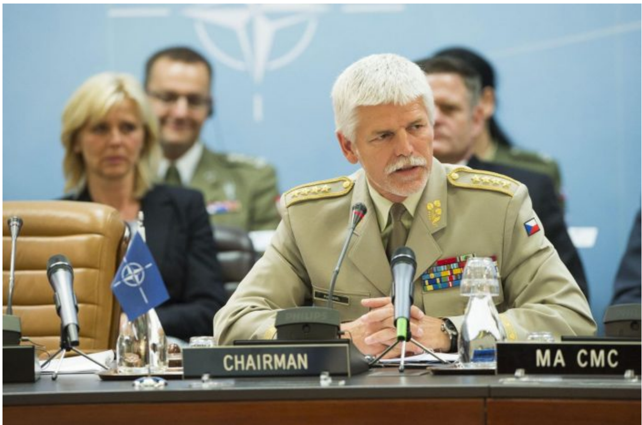
Petr Pavel jako šéf vojenského výboru NATO

K čemu došlo? No přece k tomu, že Kyjev stáhl z Donbasu celkem 3 brigády, čímž otevřel Rusům cestu. To je celé! A proč by to Kyjev dělal? Na to existuje děsivá a jedna jediná opověď – je to součást plánu NATO! Ukrajina Rusku odstoupí Donbas formou nachystané porážky AFU v bojích. Na této linii totiž nemá Ukrajina sílu zvrátit průběh bojů, pouze je dokáže zpomalovat, takže bylo rozhodnuto Donbas “prohrát” a ustoupit z něj v bojích, kdy Rusové nepůjdou zastavit. Očekává se, že po dosažení administrativních hranic Doněcké a Luhanské oblasti se Ruská armáda zastaví. Co se týče Chersonu a Záporoží, tam se zřejmě nic neposune.