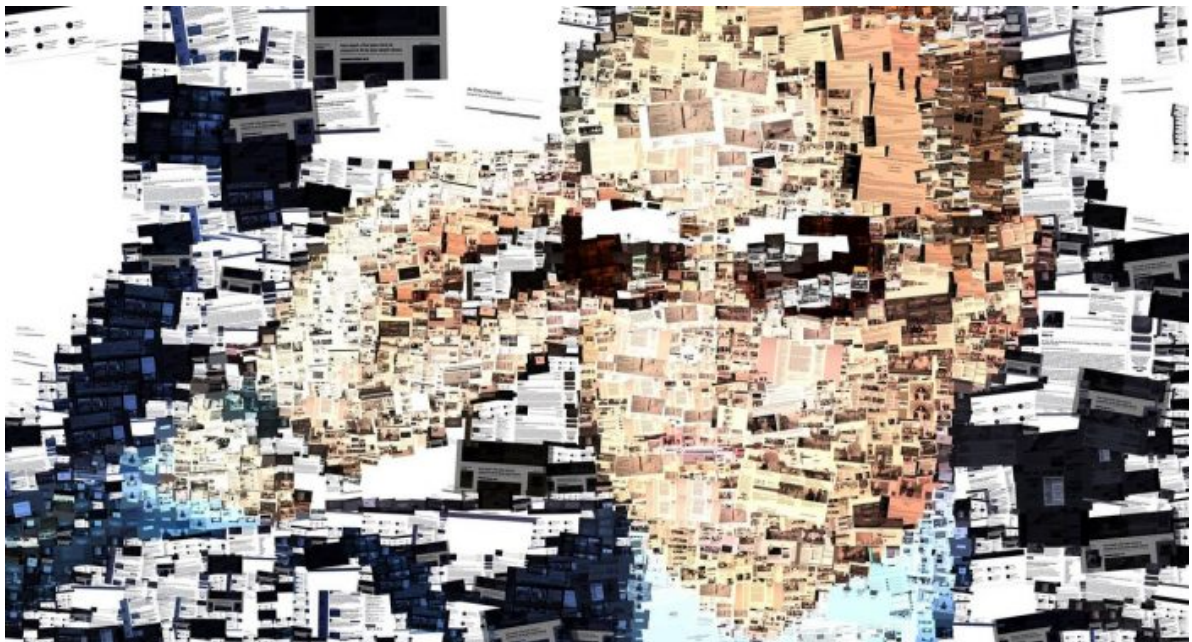
Putin je prostě úplně za vším

Proč by navíc ruský hybridní útok byl směřován na Slovensko a na slovenské školy, když u moci je na Slovensku právě Robert Fico, který je neustále citovaný v ruských médiích, v novinách a v televizi jako odpůrce Bruselu a zastánce míru na Ukrajině? Ne, tohle opravdu z Ruska nepochází. Je to zjevná zpravodajská hra proti Rusku, která je namířena ve skutečnosti na vlastní obyvatelstvo, aby došlo u obyvatel ČR k prohloubení nenávisti k Rusku po zahájení programu Kremlu na udělování azylů a pobytů v Rusku pro lidi, kteří nesouhlasí se západním neoliberalismem. Ten program začal běžet od 1. září.