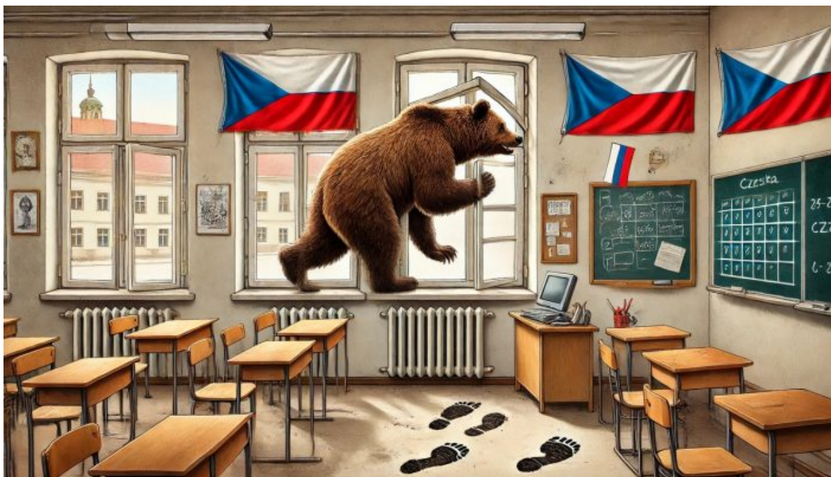
Ruský medvěd útočí na české školy

Je neuvěřitelné, jak rychle česká média věděla a měla jasno, odkud útok prý pochází, nikdo sice nic neví přesně, ale jedno je jisté, že stopy vedou do Ruska, a že jde o hybridní hrozbu z Ruska. Napojení na Dněpropetrovsk a na přezdívku dvojice vrahů skutečně naznačuje, že ve zpravodajské hře je zapojena ukrajinská SBU, která obviní v příštích dnech či týdnech pro-ruské separatisty z rozesílání emailů do českých a slovenských škol, jako že v odvetě za dodávky českých a slovenských zbraní ukrajinské AFU. Záminka prostě naprosto dokonalá.