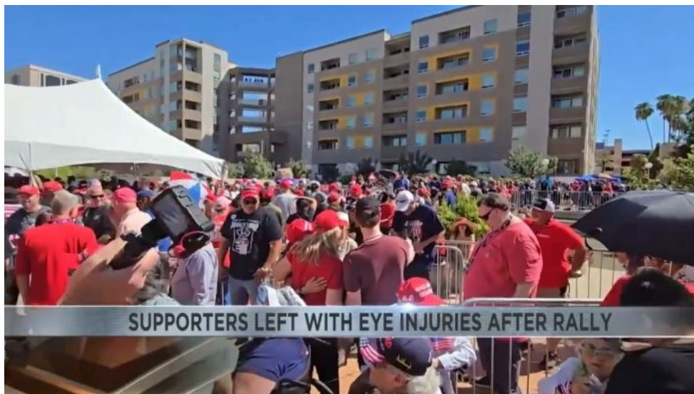
Shromáždění fanoušků před koncertním sálem v Tucsonu, kde byl projev Trumpa

Pokud se osoba dostane do pole louče mikrovlnného záření, jako první je vyvoláno nevysvětlitelné zvracení, závratě a mdloby, a to v důsledku ohřevu vnitřních orgánů v lidském těle, čímž dochází k chemickým poruchám látkové výměny a především afinity molekul kyslíku na hemoglobin, což mozek vyhodnocuje jako akutní otravu a mozek okamžitě v obranné reflexi vyvolává zvracení.