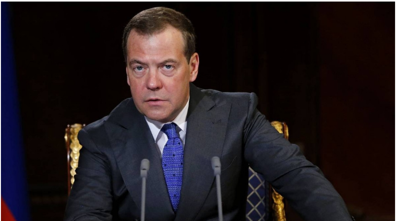
Bývalý ruský prezident a současný místopředseda ruské bezpečnostní rady Dmitrij Medveděv

Skutečnost, že se na vpádu do Československa podílely všeobecně země Varšavské smlouvy, včetně našich sousedů, se však propagátorům tohoto rčení nehodí do krámu. Ano, fakticky okupace byla nařízena Sovětským politbyrem, avšak nemohly snad státy Varšavského paktu odmítnout podílet se na vpádu do suverénní země? Mohly, invaze se již tehdy odmítly účastnit jednotky Rumunska a Albánie. Tehdejší Generální tajemník KS SSSR Leonid Brežněv byl navíc Ukrajinec a Ukrajinci se rovněž podíleli na okupaci ČSSR, stejně jako se patrně i nyní podíleli na teroristickém útoku na evropskou energetiku (Nord stream), která zapříčinila rozsáhlé a dosud trvající ekonomické škody, pro spousty firem, podnikatelů a rodin - likvidační.