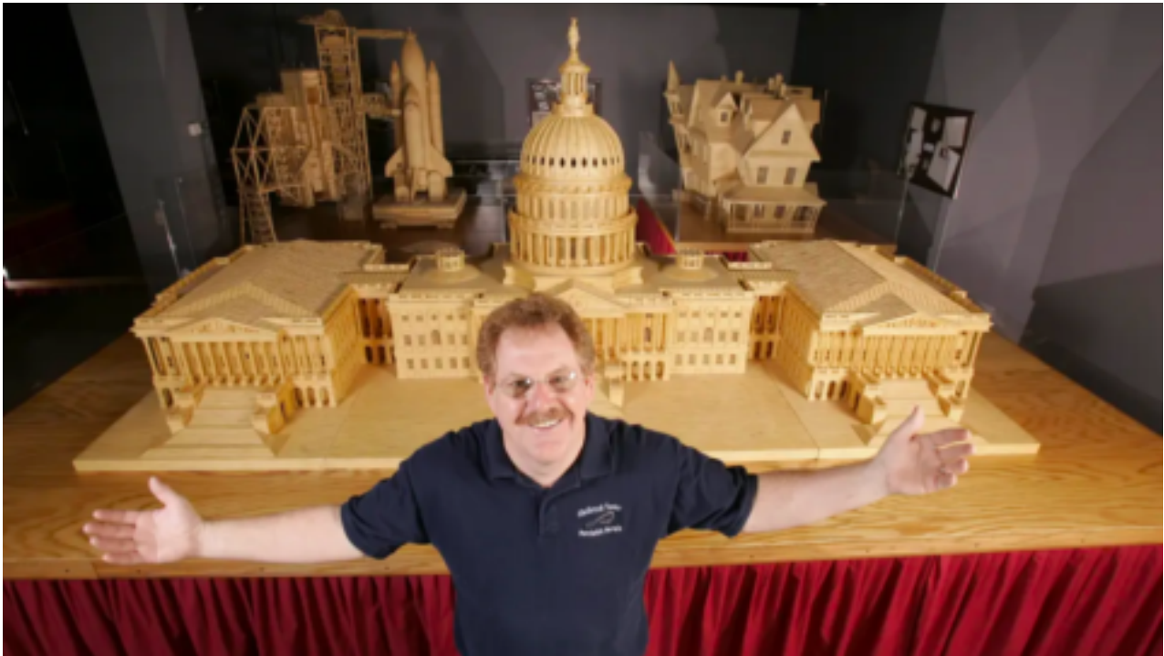
Muž z lowy_použil 7,5 milionu sirek k vytvoření neskutečných modelů lodí, hradů, katedrál a amerického Kapitolu