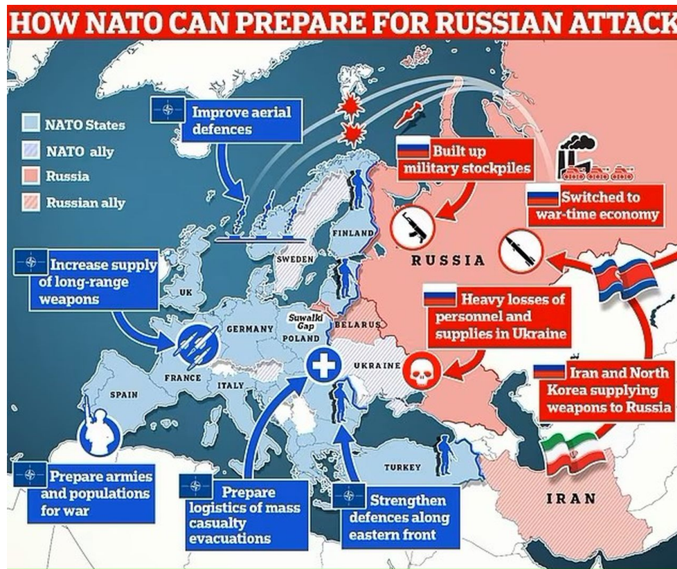
Vizualizace konfliktu NATO s Ruskem v Evropě

NATO totiž podle zdrojů BBC a Daily Mail [3] připravuje plány hromadné evakuace a záchrany pro případ budoucí války s Ruskem, prohlásil vysoký generál. Generálporučík Alexander Sollfrank, šéf logistického velitelství NATO, tento týden potvrdil, že bezpečnostní blok pracuje na zajištění operačních schopností pro odsun velkého množství zraněných vojáků z frontové linie.