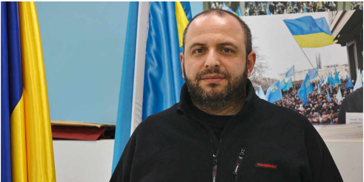
Ukrajinský ministr obrany Rustem Umerov

pomoci Ukrajině (SAG-U), Evropského velitelství Spojených států (EUCOM) a „tuctu dalších zemí v bilaterálním formátu“.