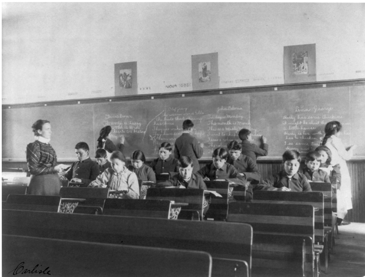
Carlisle Lekce angličtiny nebo písma pro indiánské děti v Carlisle Indian School v Carlisle, Pennsylvania, 1901.