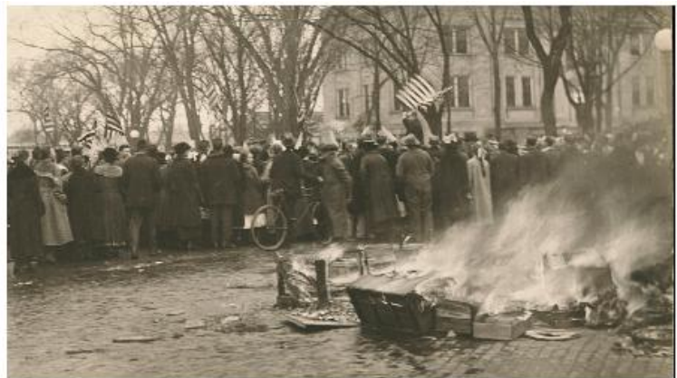
Stoh německých učebnic z Baraboo High School hoří; ulice v Baraboo ve Wisconsinu během protiněmecké demonstrace; poblíž Sauk County Courthouse v zimě nebo brzy na jaře roku 1918.

1923 Ve věci Meyer v. Nebraska rozhodl Nejvyšší soud USA, že státní zákony zakazující výuku cizího jazyka žákům základních škol jsou protiústavní. Školy začínají rušit zákazy německých programů.