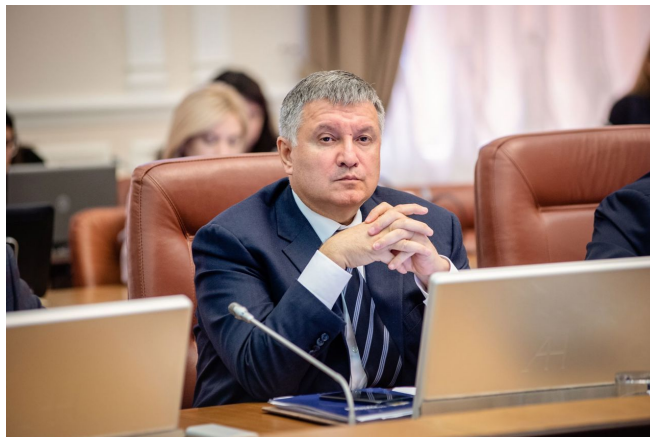
Arsen Avakov, bývalý ministr vnitra Ukrajiny

Podle Dostojevského existuje čas na válku a rovněž existuje čas na mír . A v čase války jsou v procesech řízení zapotřebí jiní vůdci než v čase míru. A to bez ohledu na to, jestli válka skončí vítězstvím nebo porážkou. Pařížský klub věřitelů Ukrajiny bude po skončení bojů chtít dostat do vedení Ukrajiny nového vůdce, který bude připraven pro čas míru.