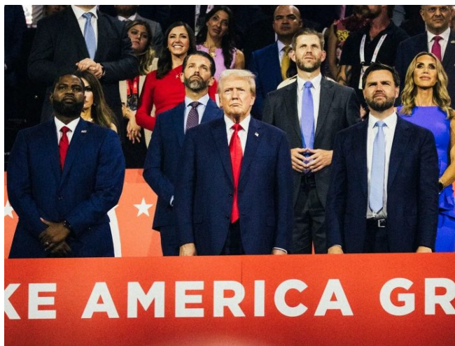
Trump je připraven a nachystán

A garantuji vám, že ten obětní beran, který ponese vinu za de facto kapitulaci Ukrajiny, kterou Zelenský bude jako lejno zabalené do zlatého staniolu vychvalovat jako Plán vítězství , je Donald Trump. Deep State v roce 2020 zfalšoval volby, protože bylo tehdy již rozhodnuto o válce na Ukrajině. A proto potřebovali do Bílého domu senilního staříka a loutku Bidena, která nebude Deep State kecat do války na Ukrajině.