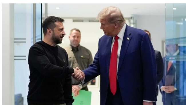
Zelenský na setkání s Trumpem v New Yorku

Ukrajina podle plánu má být přezbrojena během příměří s Ruskem, dále má Ukrajině být poskytnut status kandidátské země NATO a rovněž i kandidátský status členství v EU. A za třetí, západní země mají Ukrajině poskytnout bezpečnostní garance na úrovni článku 5 smlouvy NATO, a to i bez členství Ukrajiny v NATO. A vůbec v tom plánu není nic o tom, jestli s tím plánem bude Moskva souhlasit.