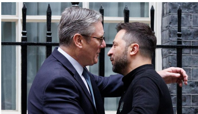
Britský premiér Kier Starmer se Zelenským v Londýně před sídlem vlády v Downing Street 10

Vlastně začínáme chápat, proč ten plán má tak prvoplánový název. On je to totiž Plán na příměří , ale zkuste být v kůži Ňuchačenka a vyjít ven v Kyjevě s takovým názvem plánu. Doma by ho banderovčiky za to ukřižovali. Takže se prostě plánu na příměří dá honosný a zavádějící název Plán vítězství , ale když se s ním politici v EU a v USA seznámí, tak zjistí, že je to podvrh a falešná reklama.