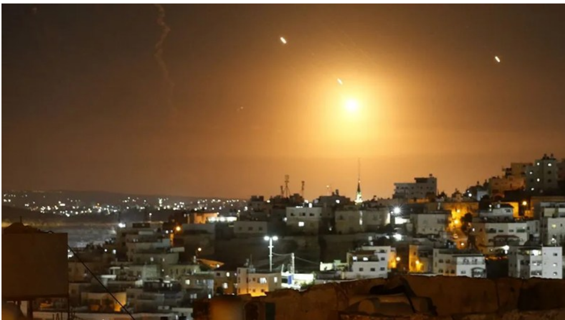
Írán zaútočil na sionistické zařízení 1. října

Jde o největší a nejničivější útok na sionistickou entitu v její 76leté historii. Úplný dopad zatím nelze předvídat. Zatímco američtí představitelé se hodiny předem obávali, že mají „indikace“, že se Írán chystá zaútočit na Izrael, načasování, rozsah a závažnost útoku všechny zúčastněné překvapilo. V předchozích dnech Washington vyslal další tisíce vojáků do západní Asie, výslovně na obranu Izraele, což Teheránu zřejmě neodradilo.