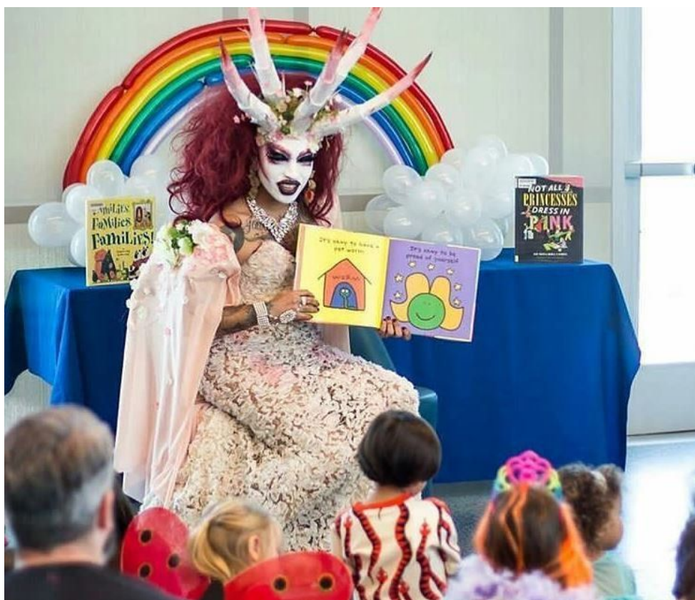
Dragová královna (muž – transvestita) vykládá dětem ve škole genderové pohádky

teorii. To je označení pro teorii o tzv. písmenkách genderů, tedy L (esbian), G (ay), B (isexual), T (ranssexual) atd. První hodiny výuky přitom vypadají normálně. Hovoří se o lidských právech, o rozmanitosti lidí, o jinakosti osob, mluví se o tom, že každý to má nějak jinak, pokud jde o pohlavní identitu a gender.