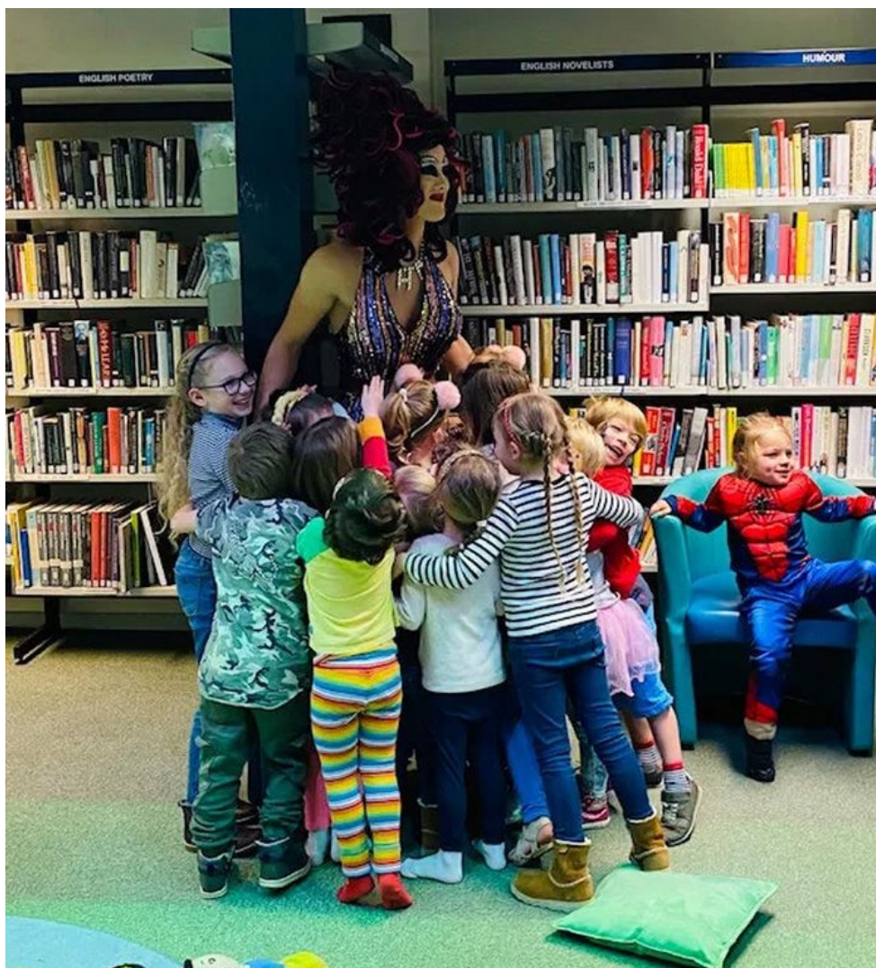
Dragová královna v knihovně navazuje vztah s malými dětmi...

A v poslední třetí fázi následuje chirurgická změna či jen odstranění pohlaví v případě non-binárních změn. Naše redakce se proto rozhodla vyhlásit výzvu, kterou prosím šířte na sociálních sítích a všude, kde to půjde. Zasílejte nám do redakce adresy škol v ČR, jejichž ředitelé zavedli výuku deviatury na svých školách, tedy introdukci LGBTQIA+ hodin a tzv. Alfabetových teorií . Rovněž nám sdělte, jestli ředitel/ka školy umožňuje či neumožňuje dítě z výuky Alfabetové teorie odhlásit. Rovněž nám sdělte jména neziskových a nevládních organizací, které se okolo výuky angažují.