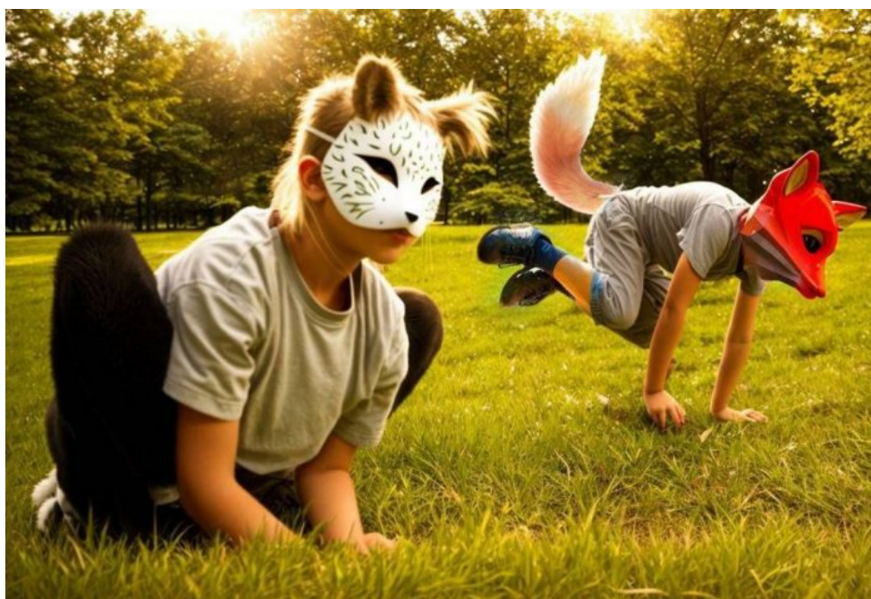
Děti postižené poruchou tzv. quadrobingu

Děti se dozví, že mají právo si o genderu rozhodovat sami a bez souhlasu rodičů, protože rodiče prý nemají právo jim do intimní otázky genderu jakkoliv mluvit. Děti se dozví, že gender může být nejen žena či muž, ale gender může být pes, koza, kočka, klokan, prostě zvíře. A pokud se dítě chce identifikovat s tímto genderem může se převléknout za psa do obleku a běhat po čtyřech, štěkat a dokonce i kousat lidi. To je prý přirozené, tvrdí zástupci NGO sektoru v USA. Dětem i dospělým převlečeným za zvířata se říká “quadrobeři” a jejich chování “quadrobing” ve smyslu překladu “ běhání po čtyřech v převleku “. Jedná se o velmi bizarní duševní poruchu, která navozuje tzv. disasociaci člověka s vlastním rodovým druhem.