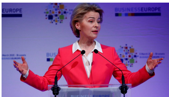
Nakonec za porážku Ukrajiny bude obviněna EU a neschopná Ursula von der Leyen