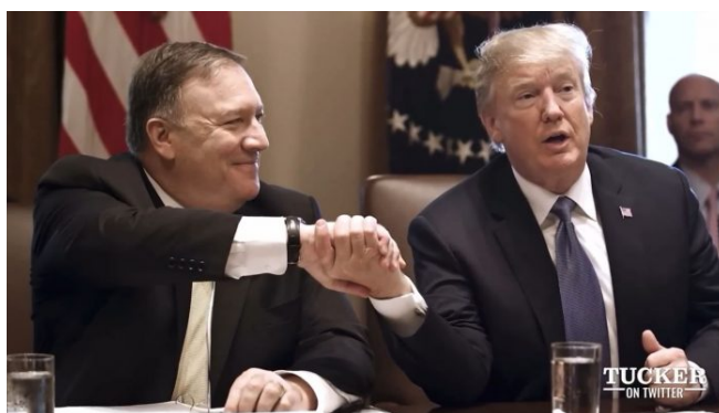
Donald Trump a Mike Pompeo během 1. Trumpovy vlády v Bílém domě

Uběhly prakticky 4 roky od posledních voleb prezidenta a situace se dramaticky obrátila. Američané jsou spolu s Německem a dalšími 7 zeměmi NATO ostře proti vstupu Ukrajiny do NATO [2] a USA chtějí z nepovedené a zpackané války na Ukrajině, která nenaplnila její cíle, tedy izolaci a ekonomický krach Ruska, a proto prostě a jednoduše potřebují vycouvat a zaměřit se na jiné hrozby.