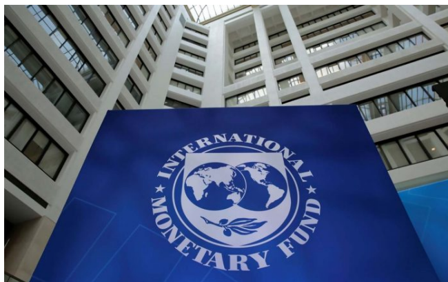
Mezinárodní měnový fond

MMF ve svém Světovém ekonomickém výhledu zveřejněném v úterý uvedl [3], že hrubý domácí produkt (HDP) Ruska v roce 2024 činí 3,55 % světového HDP v paritě kupní síly, čímž překonává Japonsko, které má 3,38 %. Podle zprávy je Rusko z hlediska parity kupní síly na čtvrtém místě po Číně (18,8 %), USA (15 %) a Indii (7,9 %). Nejnovější údaje ukazují, že mezi přední světové ekonomiky podle parity kupní síly nyní patří tři země BRICS – Čína, Indie a Rusko – poznamenávají autoři zprávy.