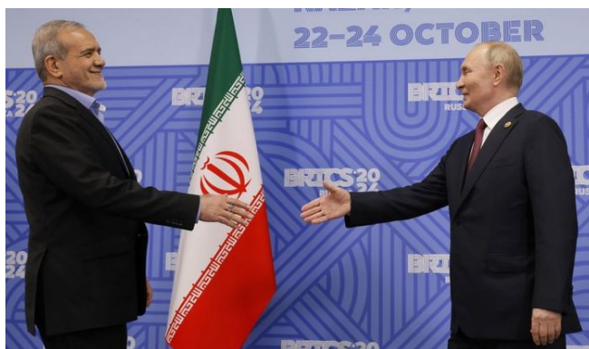
Íránský prezident Masúd Pezeškian s Vladimírem Putinem na summitu BRICS v Kazani

Bez ohledu na to, jaké figury se na těchto postech objeví, tak Trumpova administrativa bude extrémně pro-izraelská ve všech ohledech , zatímco se dá očekávat eskalace kritických vztahů s Čínou a především s Íránem, kde půjde Trump úplně ve všem na ruku Benjaminu Netanyahuovi. Válka USA s Íránem bude prakticky okamžitě a neustále na tapetě. Jenže dnešní Írán je již jiný Írán než před 4 roky.