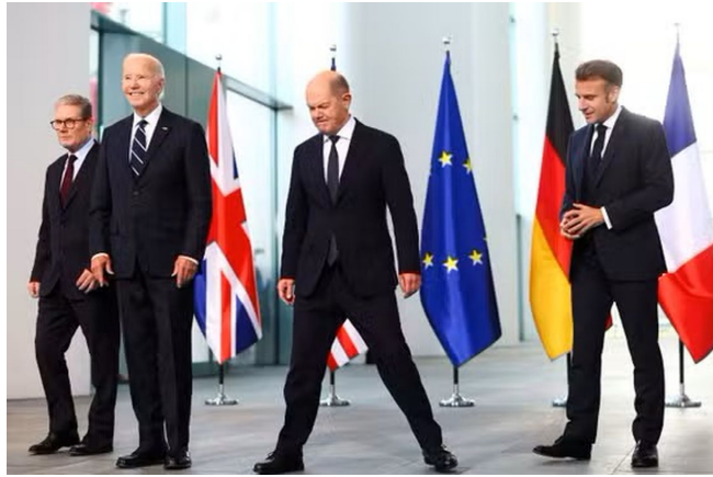
Kier Starmer, Joe Biden, Olaf Scholz a Emanuel Macron na schůzce Gangu 4 v Berlíně, 18. října 2024

Podle Popova budou Korejci fungovat v Rusku na principu samostatné vojenské brigády, která bude mít ta čísla, která již unikla do médií, tedy přibližně 10 až 12 000 mužů. Informaci o korejských vojácích v Rusku vypustil již ve čtvrtek v Bruselu přímo Volodymyr Zelenský, který se odvolával na informace jihokorejské rozvědky. Podle Olega Soskina, bývalého poradce někdejšího ukrajinského prezidenta Leonida Kučmy, nebyl Zelenský pozván na setkání tzv. "Gangu 4" v Berlíně, což je označení pro amerického prezidenta, britského premiéra, francouzského prezidenta a německého kancléře. Je to v podstatě Nejvyšší sovět skupiny G7.