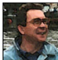
Autor: Václav Danda Publicista Více o autorovi ZDE

Současně přicházejí zprávy, že duševní stav Zelenského se po dlouhodobé konzumaci drog rychle zhoršuje a jeho rozhodnutí a závěry se stále víc mívají s realitou. V tomto stavu se zřejmě zrodil i nápad na obstarání jaderných zbraní, jako poslední šance na udržení moci. Jejich použití by ovšem znamenalo rozpoutání jaderného konfliktu nedozírných následků.