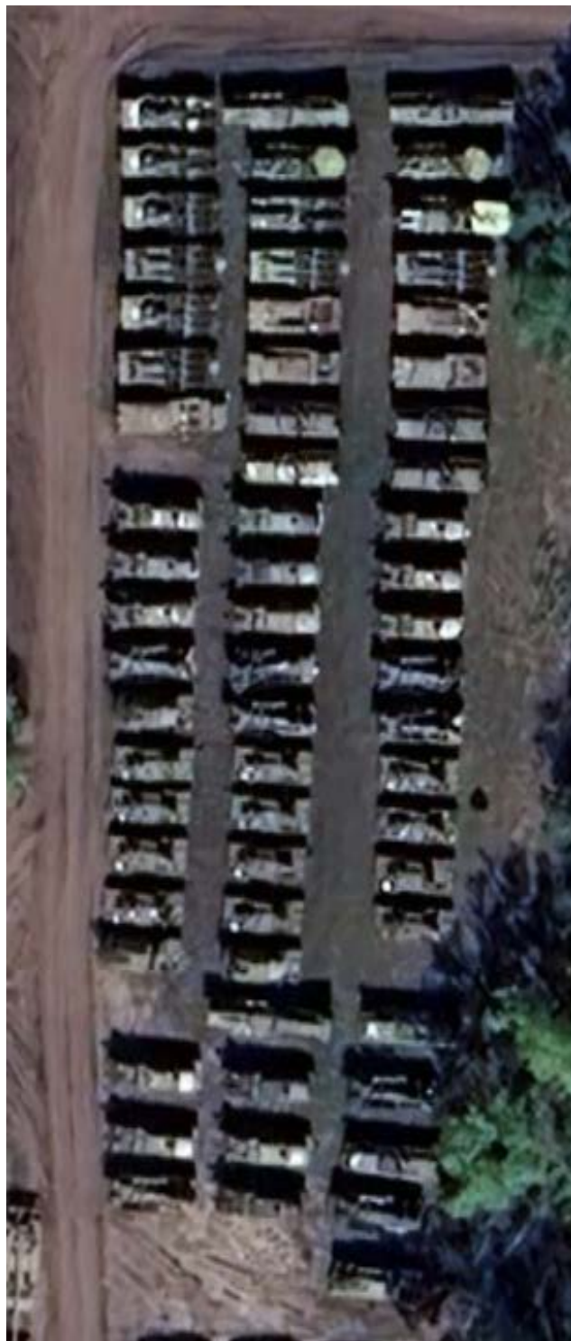
Satelitní snímek skladu S-300, TOR, a Tunguska. Sklad je na souřadnicích 55°00'54.0"N 73°23'39.7"E ve městě Omsk.

důsledku kyjevské operace ATO, zastavená od roku 2017 . Jediná Gosudarem v červenci nově opravená pec číslo 5 vyprodukuje 1 milion tun oceli ročně, tedy 28% bývalé roční produkce ostravské huti Liberty , kterou nechala letos česká vláda zkrachovat. Celkem Putin plánuje na Donbase brzy obnovit 93 000 pracovních míst v hutním a strojírenském průmyslu.