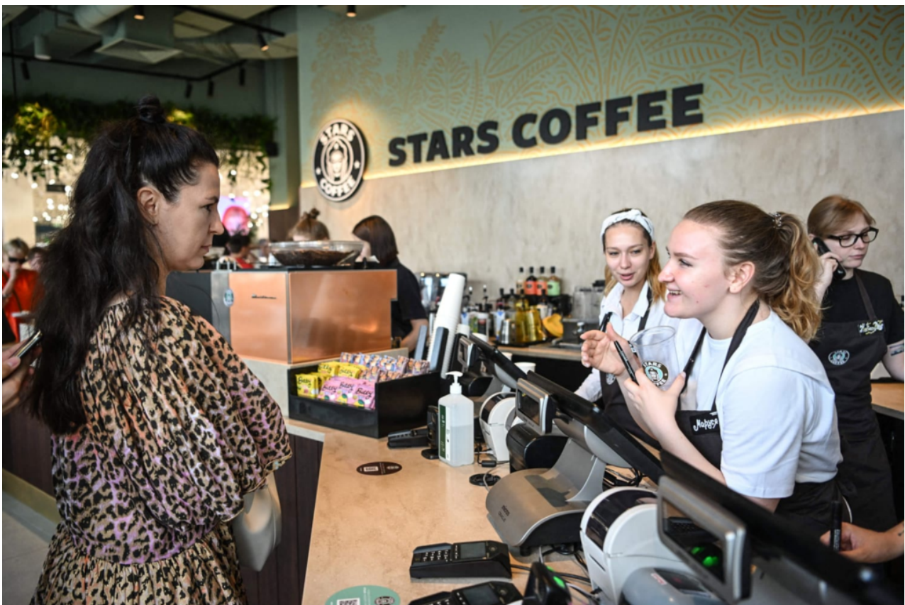
Ruské Stars Coffee

A co víc, tyto domácí značky nejenže nahradily své zahraniční předchůdce, ale také je rychle předstihly. Například již v dubnu společnost Dobry Cola oznámila, že její zisky v roce 2022 byly v roce 2023 čtyřnásobné. Connolly tvrdí, že „sankce se ukázaly jako neúčinné, což v podstatě vedlo k tomu, že se obcházení sankcí stalo odvětvím samo o sobě“. Lze dokonce tvrdit, že omezení uvalená politickým Západem nastartovala části ruské ekonomiky, které byly před SVO malé a do značné míry spící (ne-li dokonce neexistující).